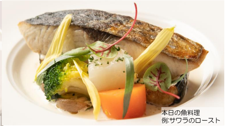
本日の魚料理 例:サワラのロースト