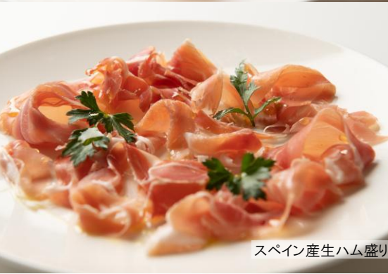
スペイン産生ハム盛り