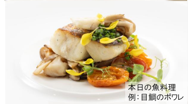
本日の魚料理 例:目鯛のポワレ