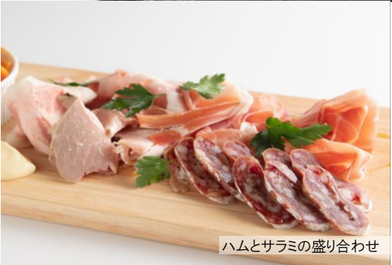
ハムとサラミの盛り合わせ