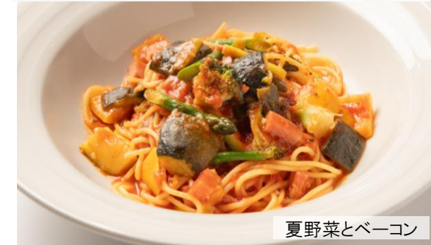
夏野菜とベーコン