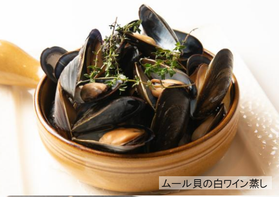
ムール貝の白ワイン蒸し