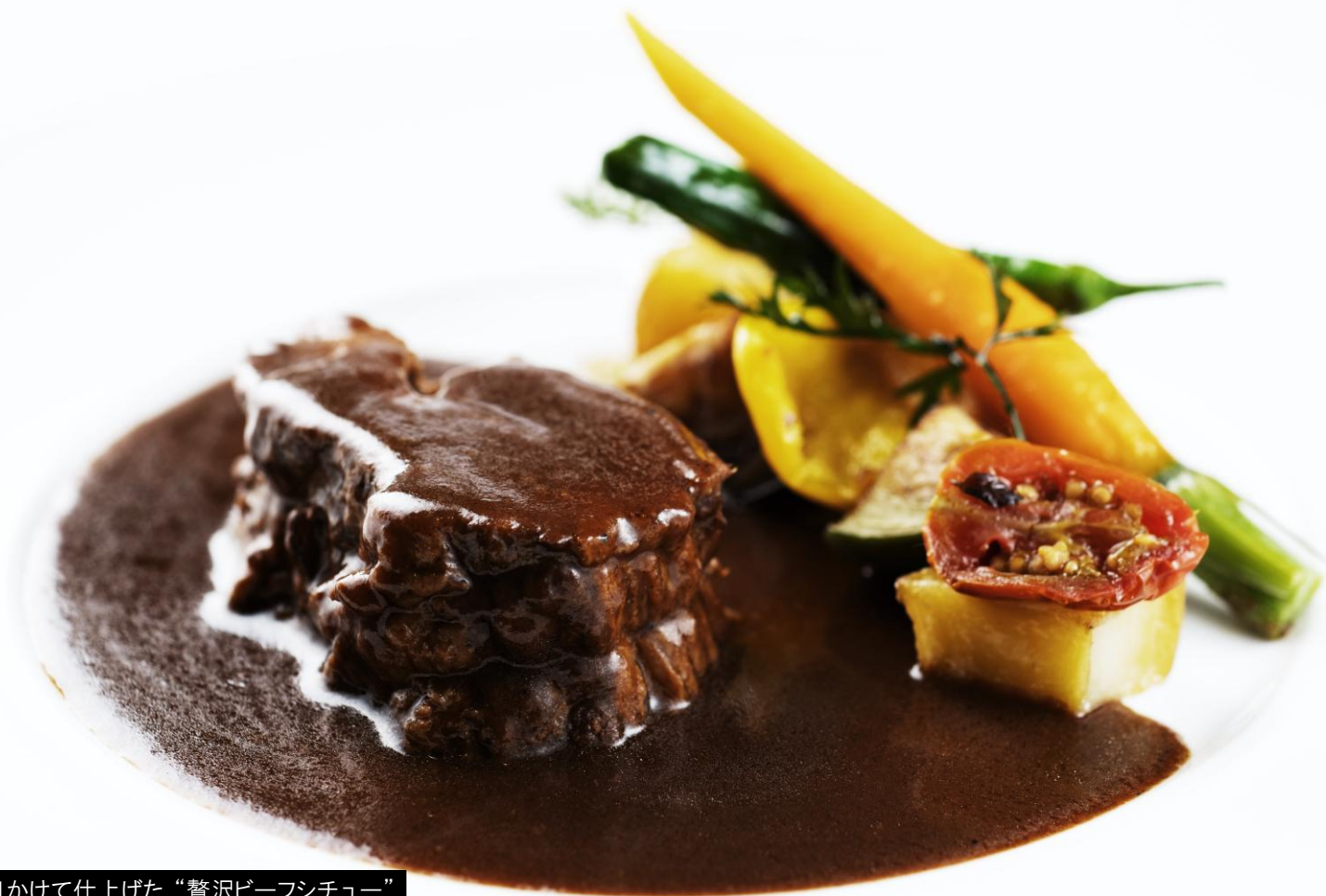
3日かけて仕上げた“贅沢ビーフシチュー”