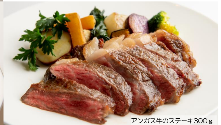
アンガス牛のステーキ300g