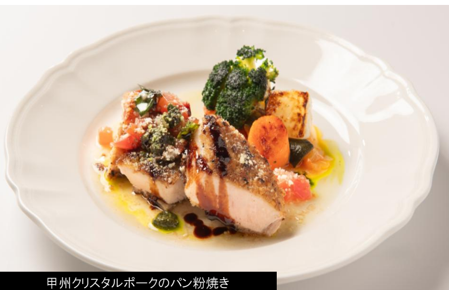
甲州クリスタルポークのパン粉焼き

パン粉を纏い、バターで香ばしく焼き上げました。酸味の効いたトマトとバジル、バルサミコソースとご一緒にお召し上がりがください!!