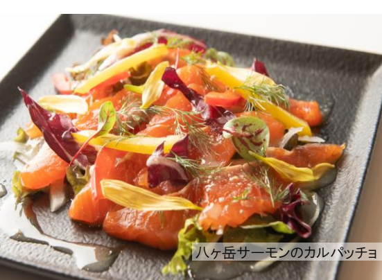
八ヶ岳サーモンのカルパッチョ