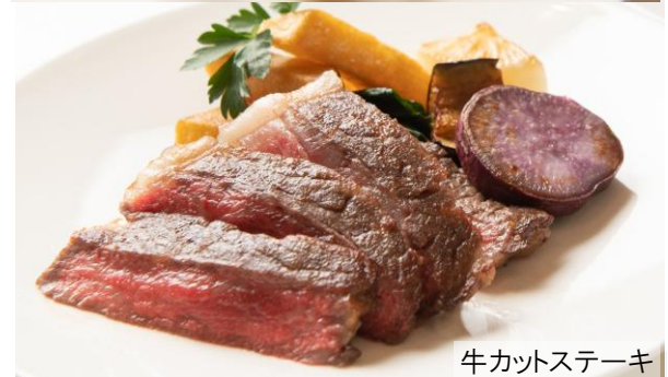
牛カットステーキ