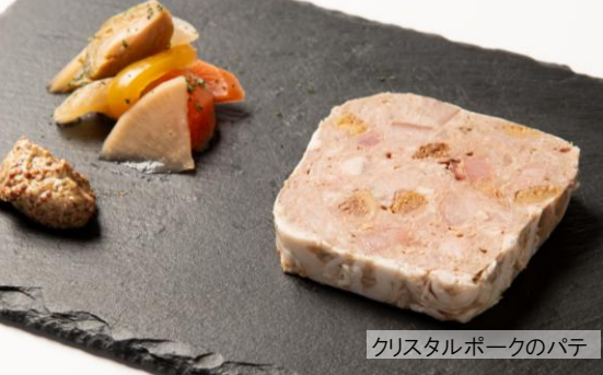
クリスタルポークのパテ