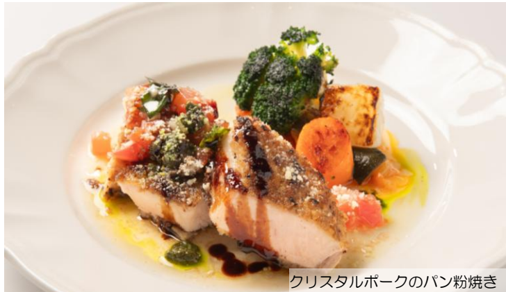
クリスタルポークのパン粉焼き