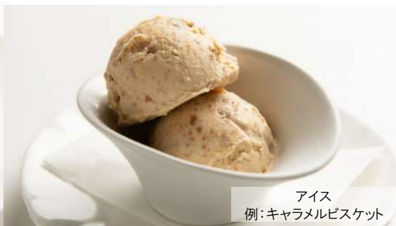
アイス 例:キャラメルビスケット