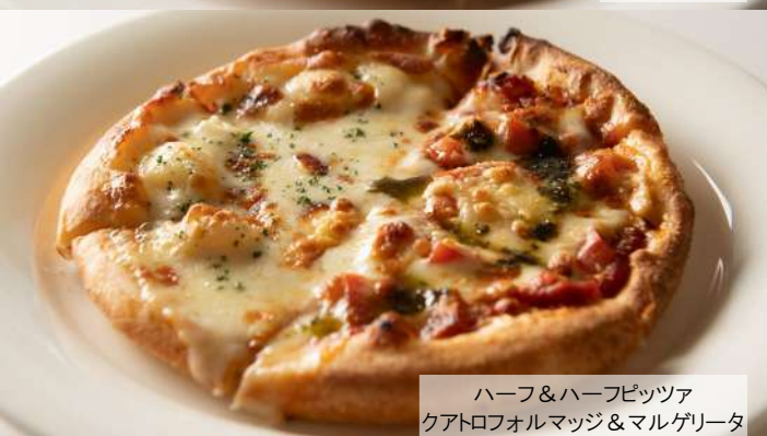
ハーフ&ハーフピッツァ クアトロフォルマッジ&マルゲリータ