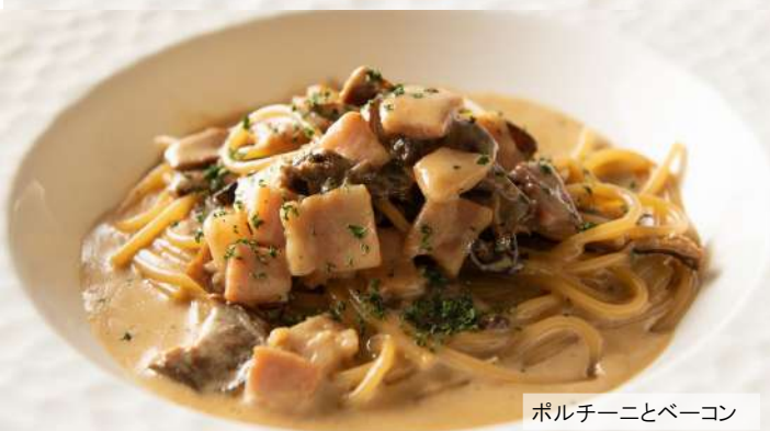
ポルチーニとベーコン