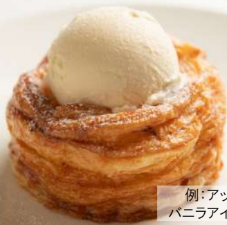
例:アップルパイ バニラアイストッピング