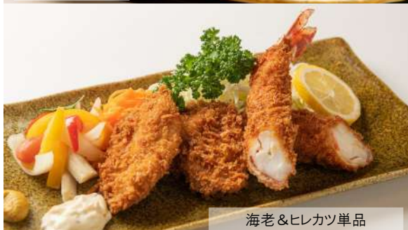
海老&ヒレカツ単品