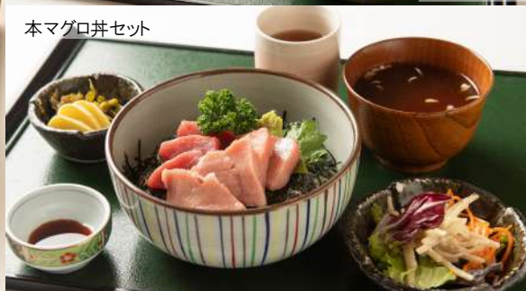
本マグロ丼セット