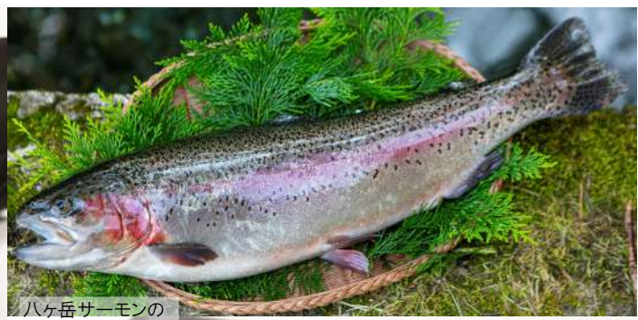
八ヶ岳サーモンの カルパッチョ