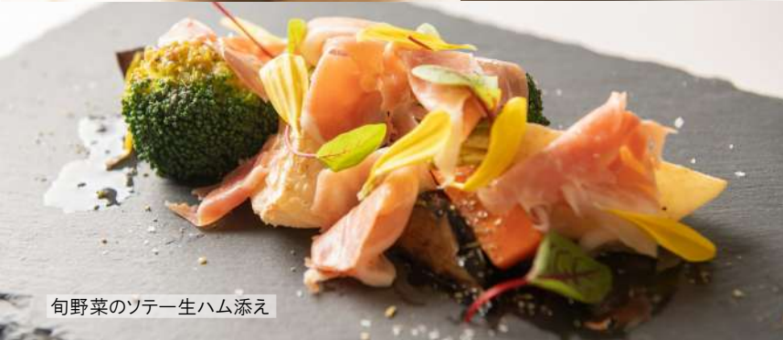
旬野菜のソテー生ハム添え