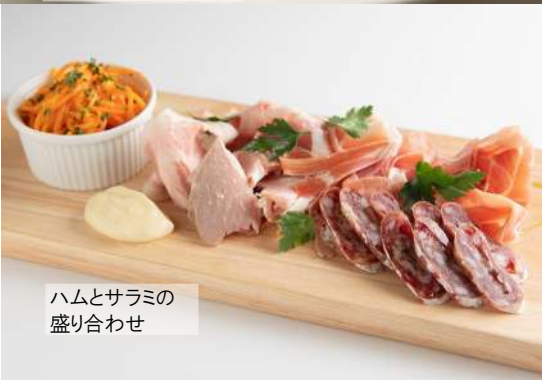
ハムとサラミの 盛り合わせ