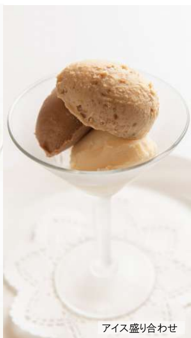
アイス盛り合わせ