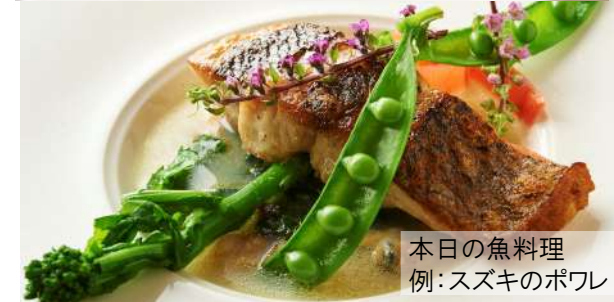
本日の魚料理 例:スズキのポワレ