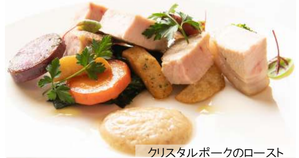
クリスタルポークのロースト

パスタ 1,900 ※パスタにはライスorパンはつきません (下からお選びください)