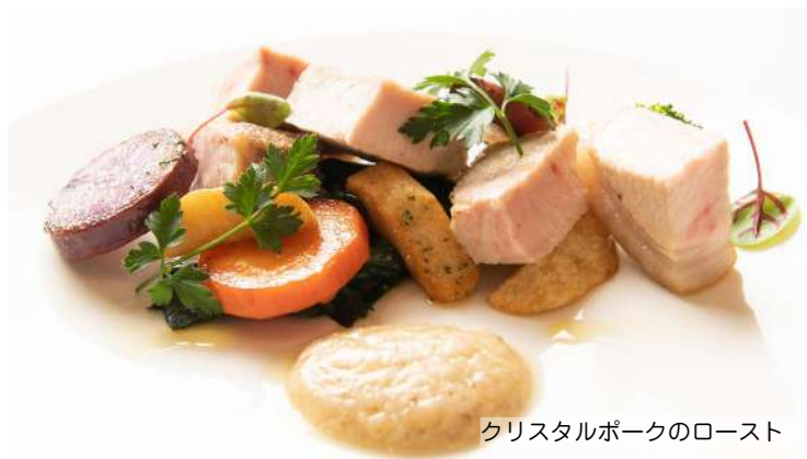
クリスタルポークのロースト