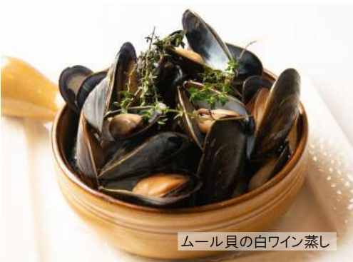
ムール貝の白ワイン蒸し