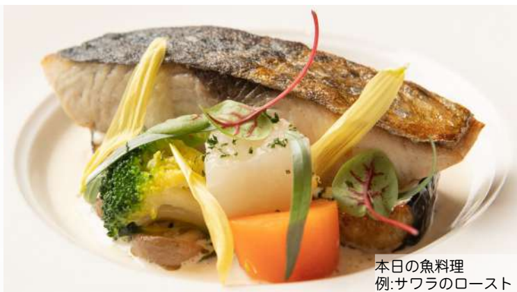
本日の魚料理 例:サワラのロースト