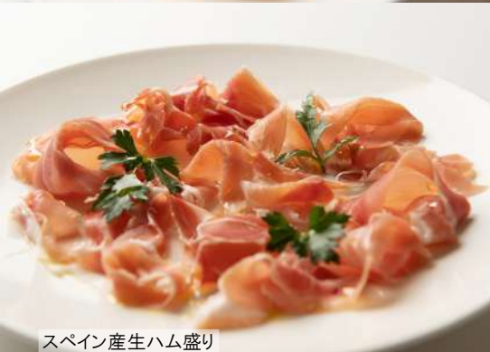
スペイン産生ハム盛り