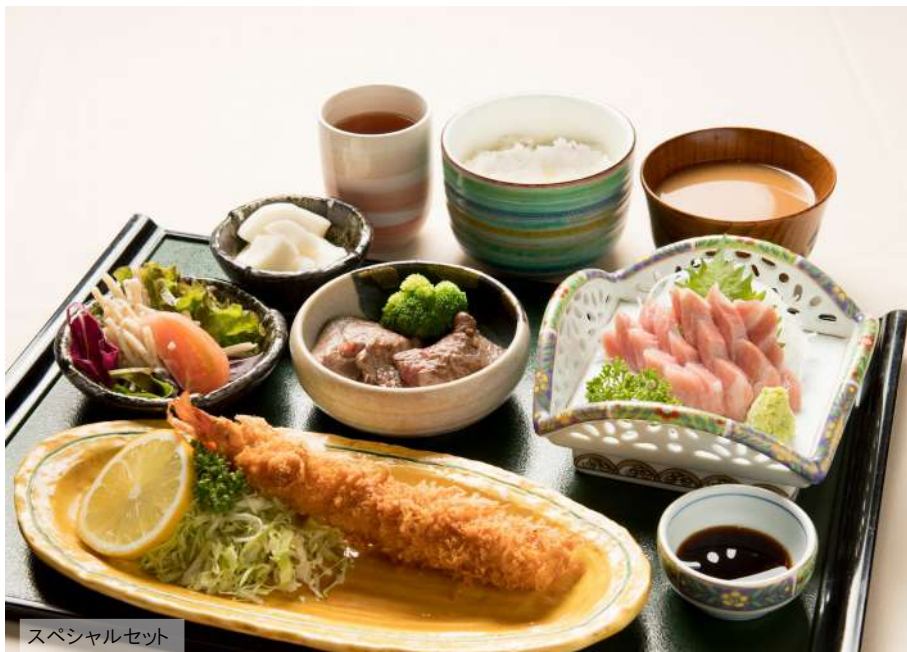
スペシャルセット