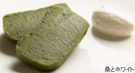
桑とホワイトチョコ の濃厚テリーヌ