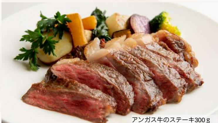
アンガス牛のステーキ300g